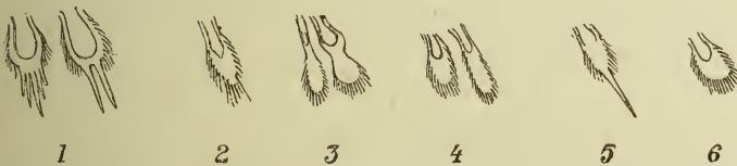
Fig. 1. — Écailles du 8 e segment des larves de moustiques.

1, Theobaldia longicaudata ; — 2, Ochlerotatus dorsalis ; — 3, Culex hortensis ; — 4, Theobaldia annulata ; — 5, Ochlerotatus communis ; — 6, O. detritus .